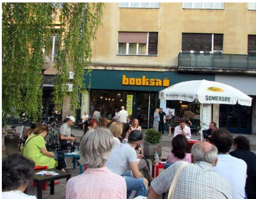
Javno čitanje priča polaznika/ca tzv. Ferićeve radionice, lipanj 2018.