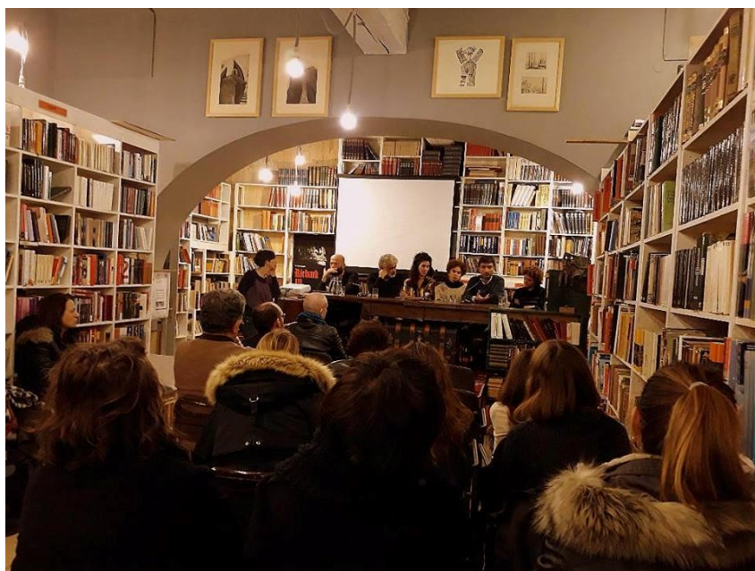
Revija malih književnosti – Levant, knjižara i antikvarijat Ex Libris, Rijeka

U suradnji sa Savezom udruga Klubtura te u sklopu programa CT-HR Razmjena i suradnja realiziran je segment festivala Revija na putu. U sklopu njega gosti su posjetili četiri hrvatska grada i to Osijek, Vukovar, Dubrovnik i Rijeku te u suradnji s lokalnim partnerima upoznali lokalnu publiku i književnike. U Osijeku je program održan u Gradskoj i sveučilišnoj knjižnici, u Vukovaru u Gradskoj knjižnici, u Dubrovniku u Narodnoj knjižnici Grad te u Rijeci u antikvarijatu i knjižari ExLibris. Posebno važno je istaknuti da je publika u ovim gradovima bila dobrim djelom srednjoškolska populacija koja je imala veliki interes za kulturu i književnost Levanta. Gosti su se upoznali sa svojim kolegama u Rijeci te s programom Europske prijestolnice Kulture Rijeka 2020.