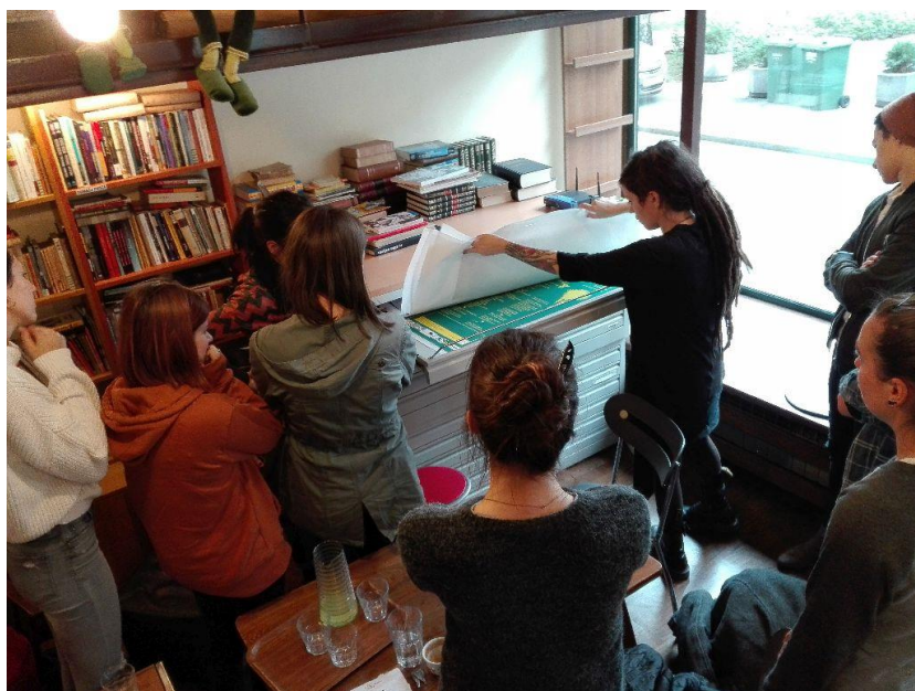
Studentska praksa u Centru za dokumentiranje nezavisne kulture

U 2017. je dvoje volontera u Centru odradilo ukupno 23 sata na aktivnostima sređivanja zbirke plakata, pomoć u provedbi manifestacije Dani otvorenih vrata udruga u Centru te pomoć u organizaciji konferencije „Nezavisna kultura i civilno društvo: izvaninstitucionalne prakse dokumentiranja povijesti“.