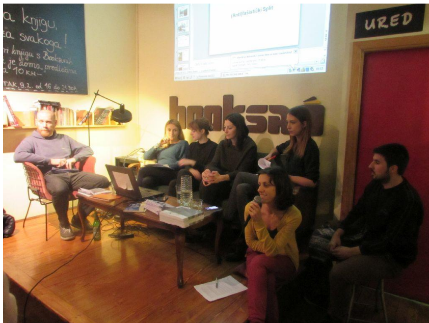
Predstavljanje novog broja časopisa „Nepokoreni grad“ Mreže antifašistkinja Zagreba