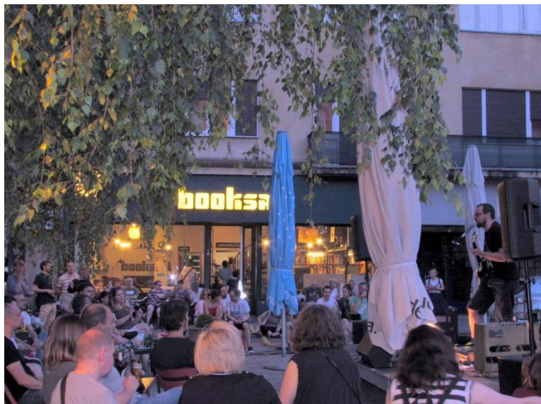
Booksa u parku, koncert Bebe Na Vole (Adam Semijalac)