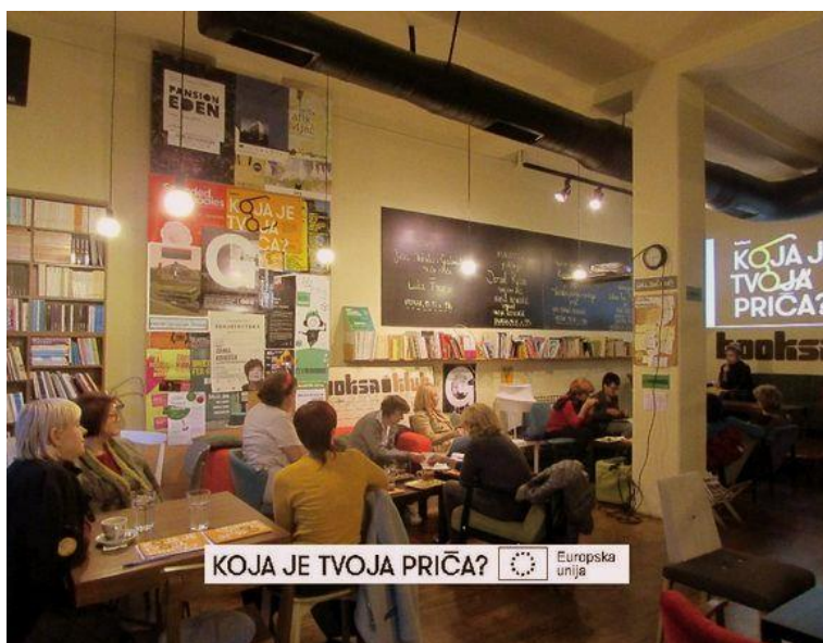
Timsko pisanje i pričanje priča Raspričavanje

Glavni cilj ovog projekta bio je omogućiti našim sugrađankama i sugrađanima starijim od 55 godina da se kreativno izraze kroz pisanje, da kvalitetno provode vrijeme na čitateljskim druženjima i u razgovorima s piscima i spisateljicama i da se zabave u pokušajima da u društvu osmisle, ispričaju ili ilustriraju priče. Namjera projekta, dakle, bila je osnažiti kreativne i socijalne vještine ukupno 65 osoba i potaknuti ih da aktivno sudjeluju u kulturnom životu. U 2019. godini održana je Radionica proze pod mentorstvom Zorana Ferića i Radionica poezije pod mentorstvom Dorte Jagić. Također je održana Radionica ilustriranja književnog teksta koju je vodio kolektiv Škart, odnosno Dragan Protić i Đorđe Balmazović. U sklopu Čitateljskog kluba 54+ pročitano je i prokomentirano devet knjiga uglavnom domaćih autora i autorica, a s petero njih održani su i Književni kružoci (Damir Karakaš, Tea Tulić, Jurica Pavičić, Olja Savičević Ivančević i Marko Gregur). Ivana Bodrožić bila je voditeljica devet događanja nazvanih Raspričavanje u kojem su se zajednički, u malim grupama od 3 – 5 osoba, pisale kratke priče na zadane pojmove. Projekt je sufinancirala Europska unija iz Europskog socijalnog fonda. Radove nastale na radionicama održanim u sklopu projekta možete pronaći ovdje https://klub.booksa.hr/dogadjanja/koja-je-tvoja-prica .