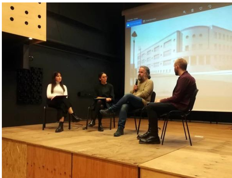
Razgovor učenica i učenika Klasične gimnazije i Miljenka Jergovića

https://booksa.hr/kolumne/razumijem-sto-citam/razumijem-sto-citam-1563991164