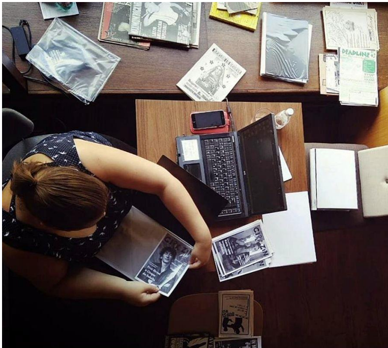
Studentska praksa u sklopu Centra za dokumentiranje nezavisne kulture