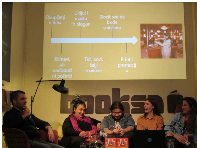
Predstavljanje „MyMap Split“, udruga Info zona iz Splita