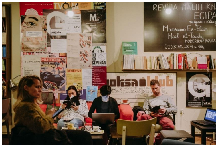
Klub Booksa