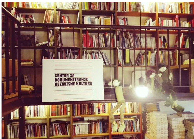
Arhiv Centra za dokumentiranje nezavisne kulture u klubu Booksa