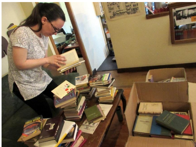
Sortiranje knjiga za akciju „Svi za knjigu, knjiga za svakoga!“